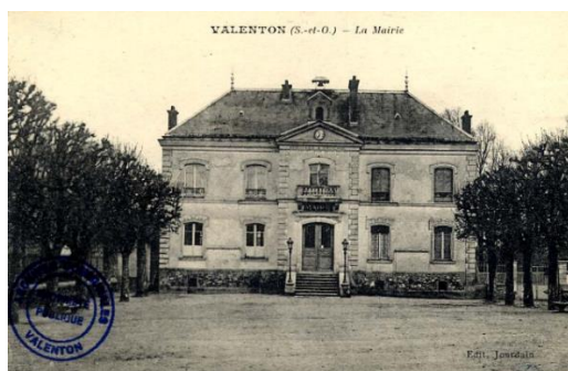
La mairie école (actuelle bibliothèque municipale)

La mairie école fut construite entre 1875 et 1878 pour y abriter la classe des garçons, le logement de l'instituteur, le cabinet du Maire et la mairie. La place située à l'avant du bâtiment prit le nom de place Paul Vaillant-Couturier en 1937. L'école cessa de fonctionner à la fin des années 1950. En 1968, le maire et sa petite administration quittèrent la bâtisse et vinrent s'installer dans la maison qu'elle occupe encore de nos jours (propriété Bariquand). Par la suite, le bâtiment abrita d'autres services dont la bibliothèque municipale. Depuis 2005, ce lieu dénommé « Espace Julien Duranton » est entièrement dédié à la bibliothèque et à la lecture publique.